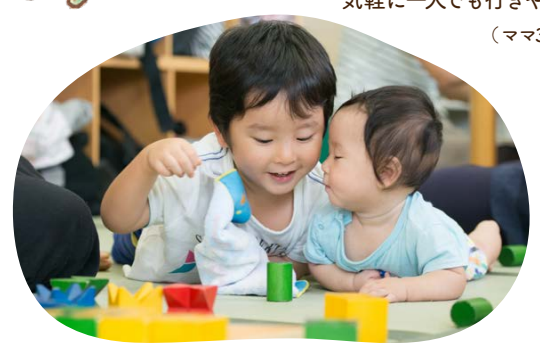
気軽に一人でも行きやすいです。 (ママ30代/子1歳)

初めて遊びにきた頃はおもちゃを奪い取ってばかりの息子が、通い始めて2ヶ月くらいたったころに自分より月齢の小さい子におもちゃをどうぞと渡して嬉しかった。 (ママ30代/子1歳)