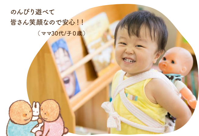
のんびり遊べて 皆さん笑顔なので安心!! (ママ30代/子0歳)