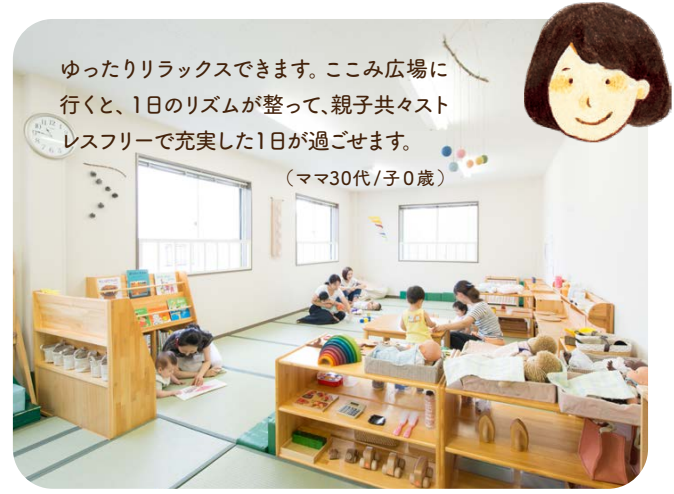
ゆったりリラックスできます。ここみ広場に行くと、1日のリズムが整って、親子共々ストレスフリーで充実した1日が過ごせます。 (ママ30代/子0歳)